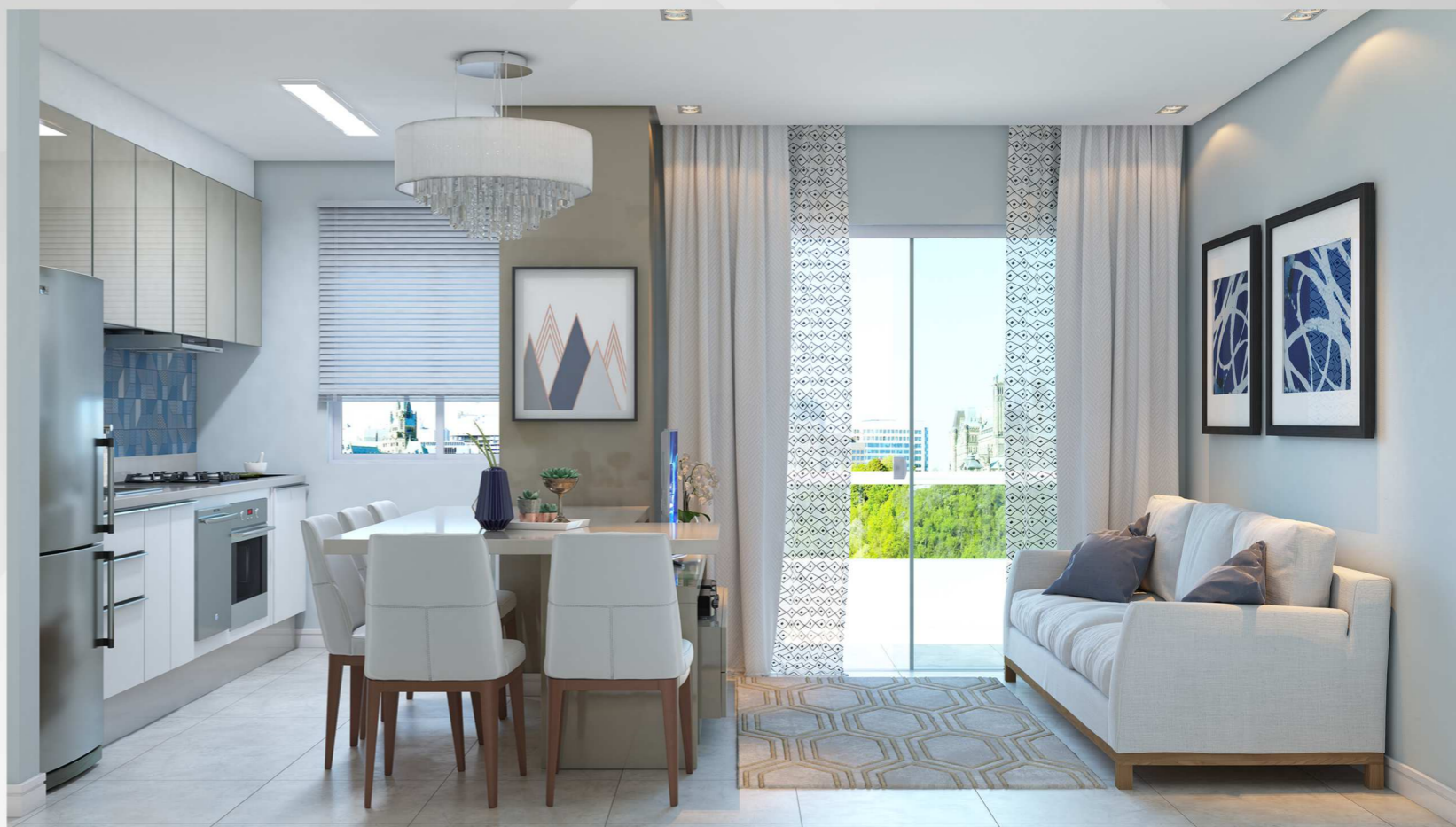
Cozinha Sala jantar/estar