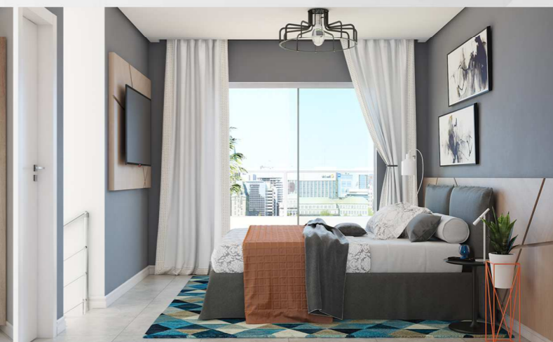
Suíte - sótão