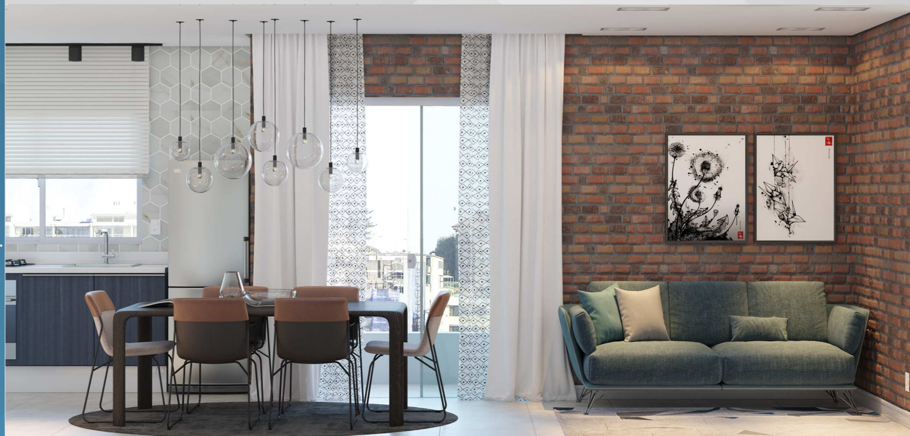
Cozinha Sala jantar/estar